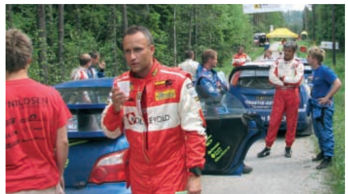
I bakgrunnen skimter du vår NAFgule etappeprofilering.

Arbeidet er i gang for å se om vi kan arrangere Autoslalom i Asker og Bærum. Motorsportskomiteen har vært i kontakt med flere Autoslalom kapasiteter og er spent på hva høsten vil bringe.