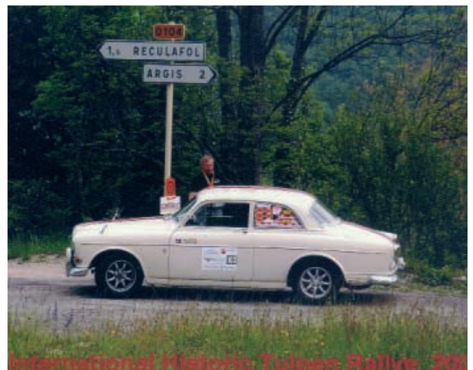
International Historic Tulipen Rallye 2005