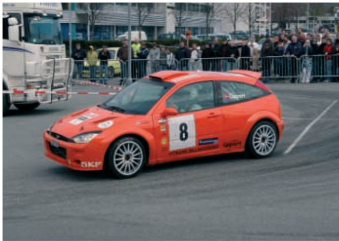
Jarle lånte Focusen til Einar Staff under årets rally Stavanger tidligere i våres. Det ble en flott 2.plass totalt som Jarle anser som et av sine beste resultater så langt i karrieren.