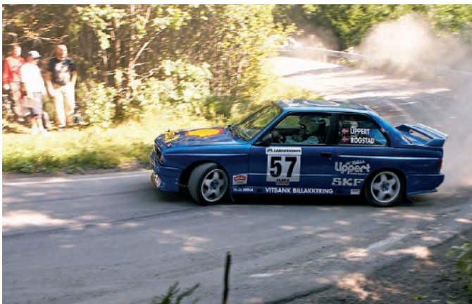
Det gikk fort under rally Grimstad 2006, men noen prøver senere manglet vitale deler i forstillingen og det var en sur realitet å måtte bryte...

Det siste må vi jo si oss enig i, men sterkt krydret mat burde vel helst vært brukt til å smøre sykkelkjeder med..