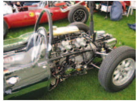
Gamle "racebiler" er også vakre...