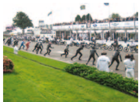
Morsomt med LeMans start...