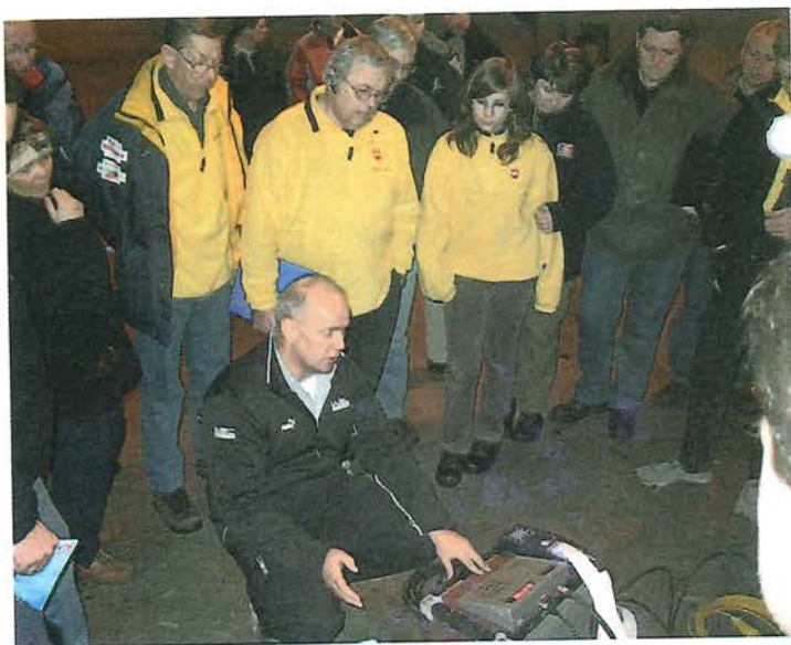
Opplæring på Haslemoen

Dette var imponerende innsats fra alle våre trofaste og dyktige funksjonærer.