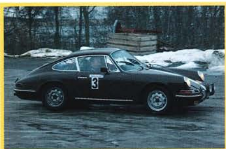
Kjell Gudim & Helge Stubberud, start nr. 3 i sin Porsche - vant klasse A i Vinter Challenge 2006.