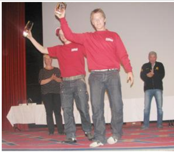
Bildetekstene må komme senere....