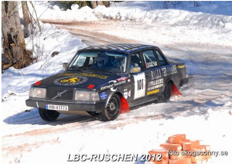
LBC-RUSCHEN 2012