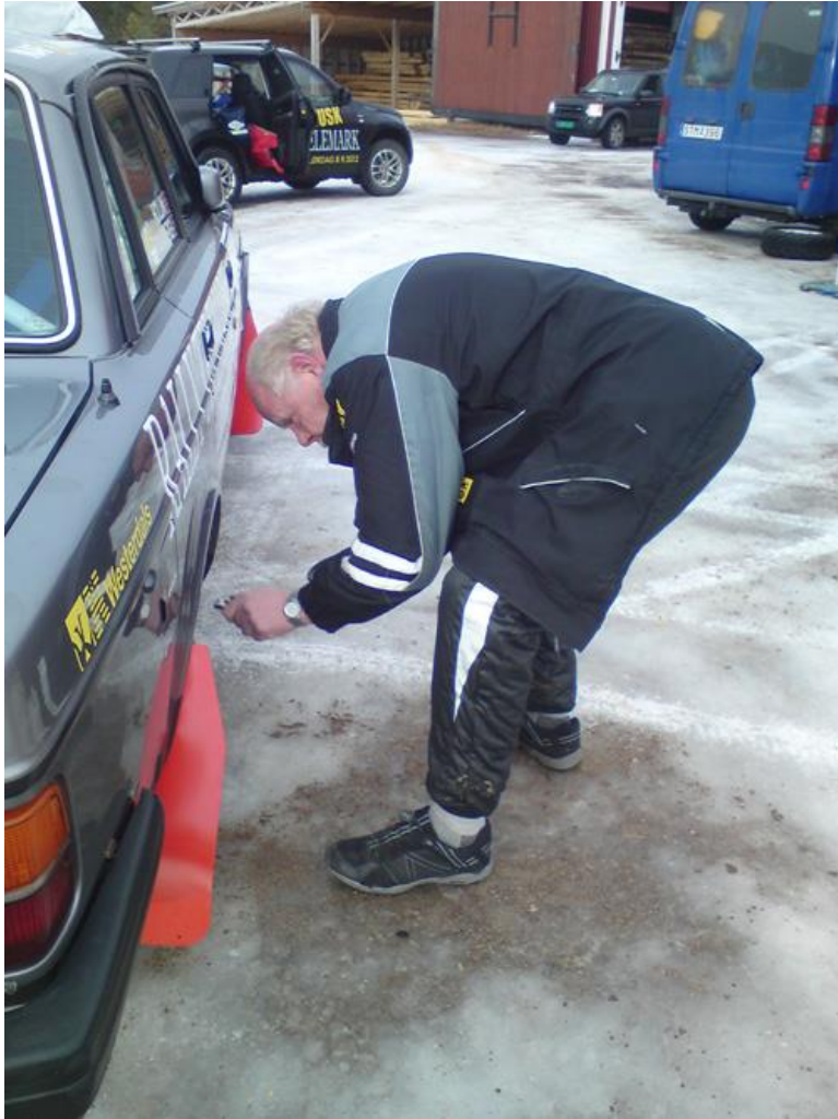
Volvo Telemark Edition over.