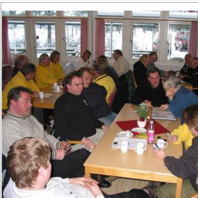
Vi er klare for klokkekurs på Haslemoen: