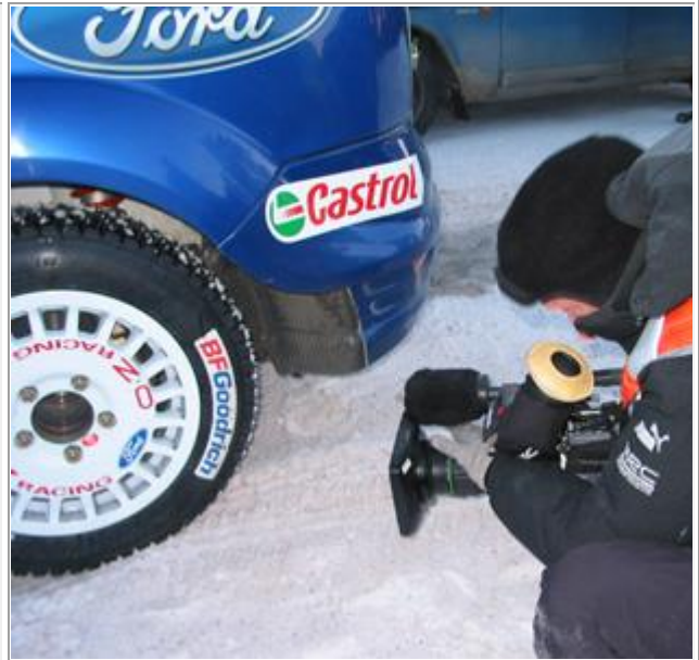
Gode arbeidsforhold viktig for pressen, håper han lukker munnen.