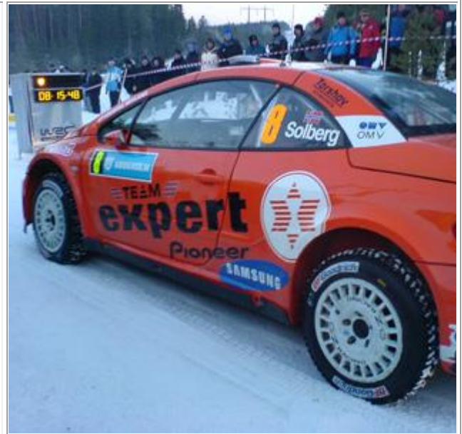
Klar med klokker.