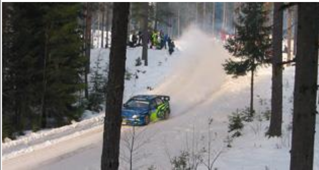
Petter i løypa, publikum på god avstand