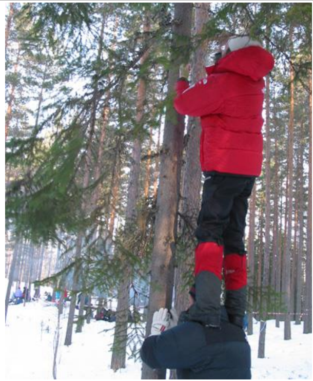
Her har vi karer som kan rydde publikumsarealer i 2007 hvis de ikke har noe ratt og holde i.