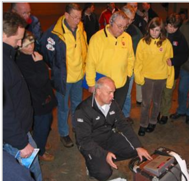
Vår engelske guide inn i systemet, gjorde en god opplæringsjobb.