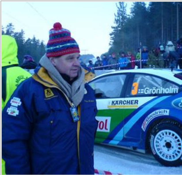
Har jo alltid vært litt Grønholm fan jeg da.