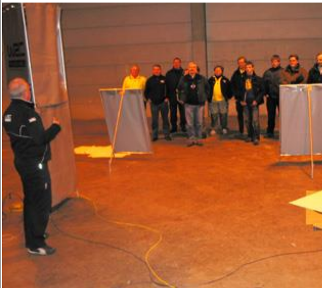
TK inn teori.