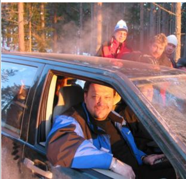
TK inn, vi kontrollerer ja.