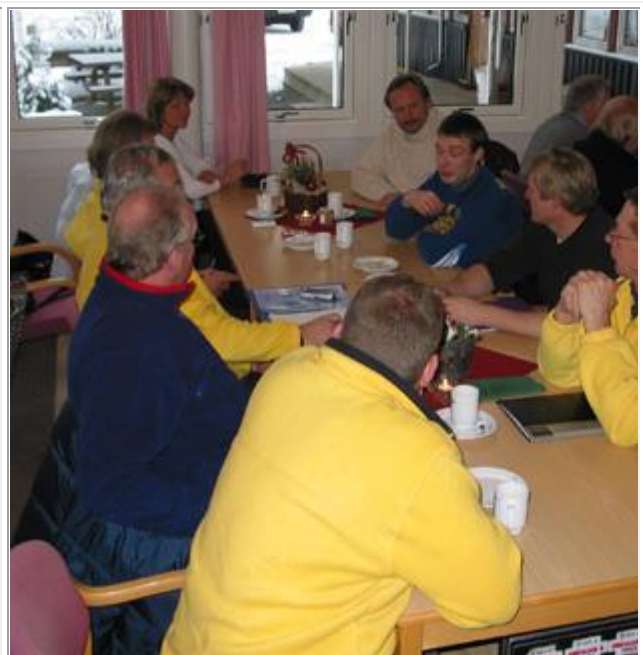
Hvordan blir dette, får vi orden på WRC klokkene?