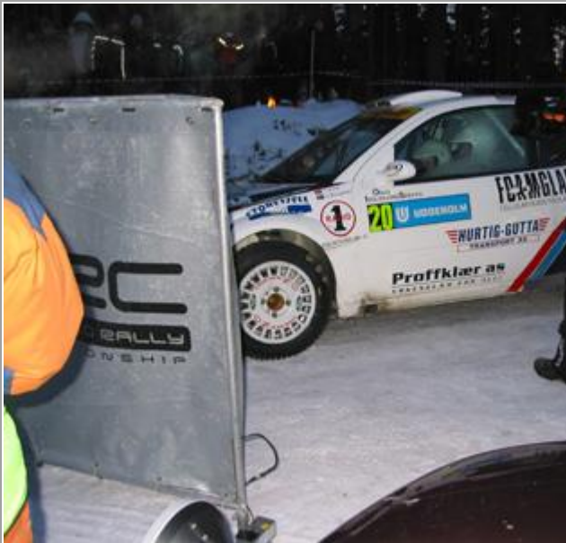
Eurosport på plass har oppdaget vår man, ja.