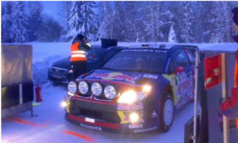
Start nr. 1