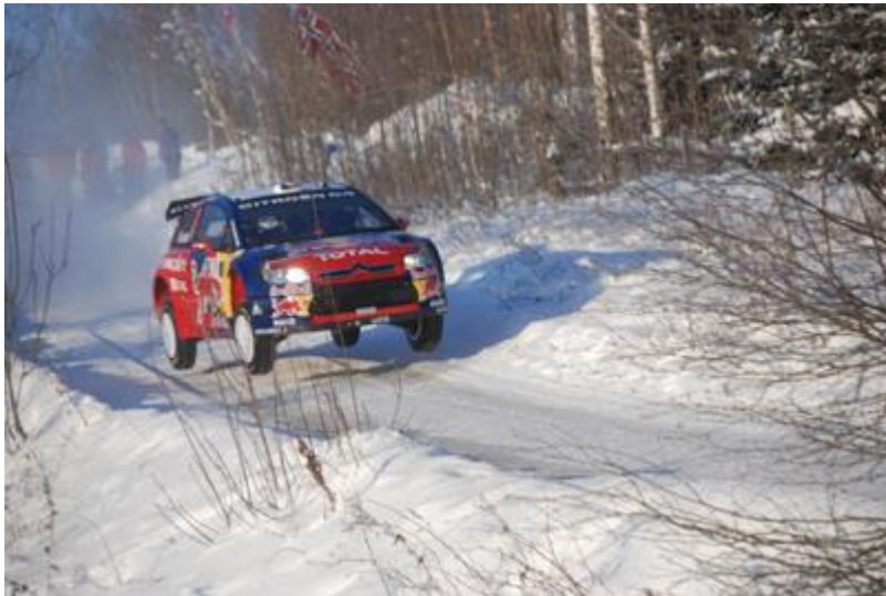
Seb på shakedown