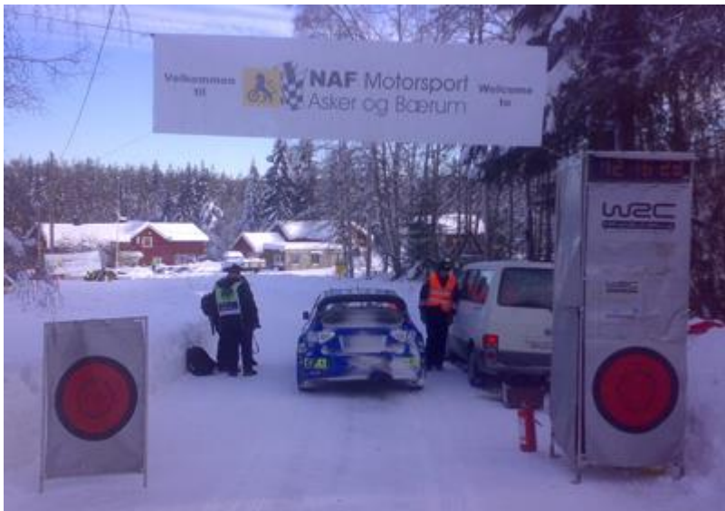
Vi er ferdig rigget