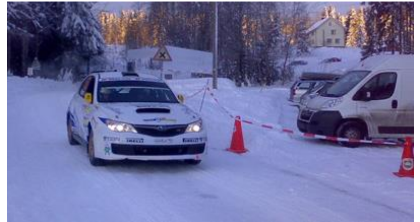
Her på SS 18-21