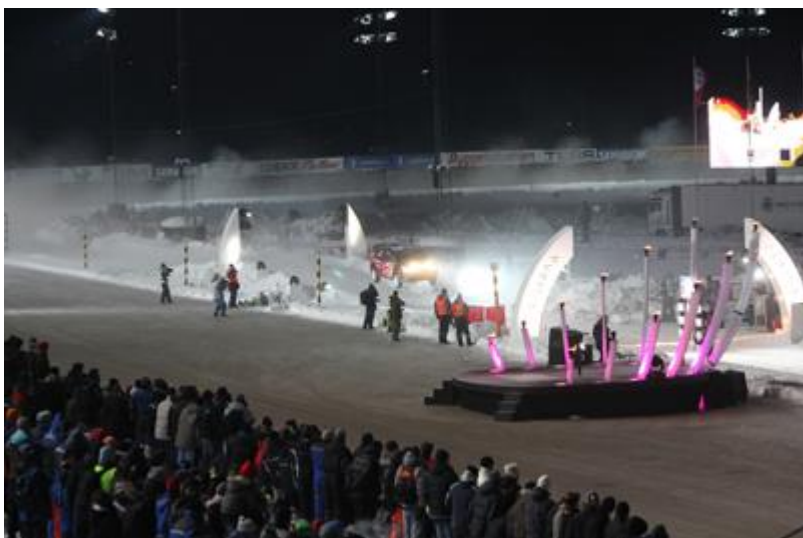
Åpningen på Bjerke hos Oslo NAF