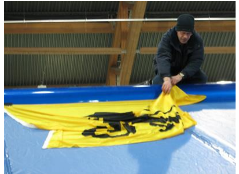
og på taket av Prodrive traileren