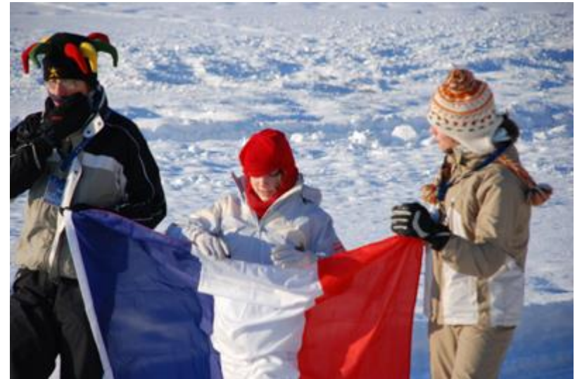
Hvem heier disse på tro?