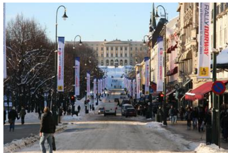
Kongen flagger også for Rally Norway på Karl Johan

Her finner du NAF teamene som kjørte Rally Norway