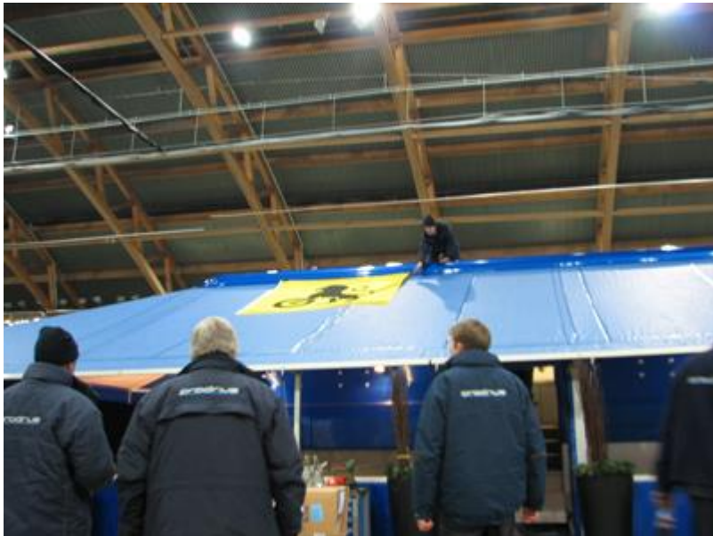
Gutta hos Prodrive er nøye med flagg, legg merke til at den stolte NAF løven peker mot pallen