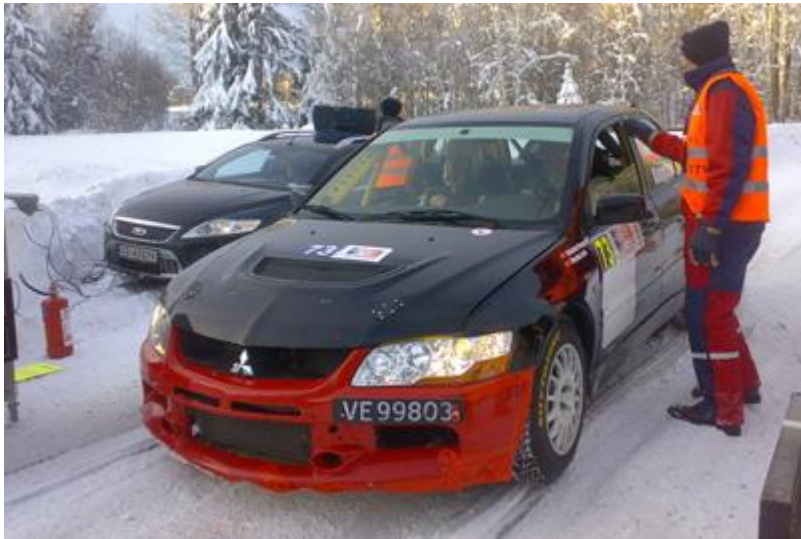
Kongsrud og Isdal på SS 18-21