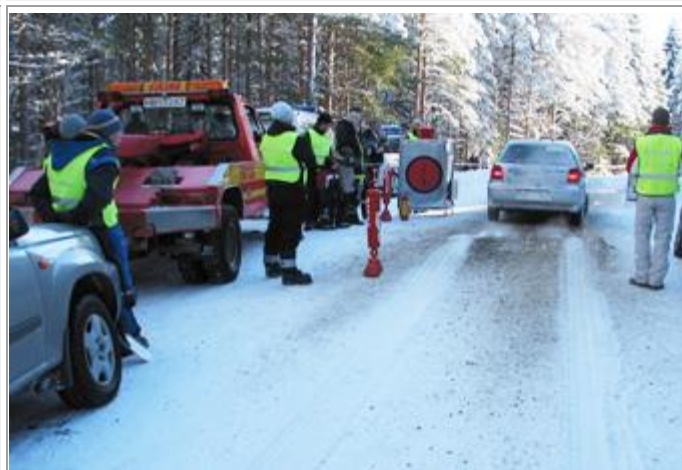
Og Willum har startet sin jobb.