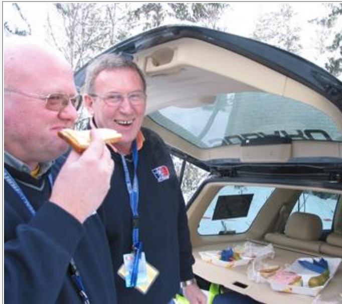
Nilsen & Nilsen spiser frokost på SS 12, litt utpå dagen kanskje.