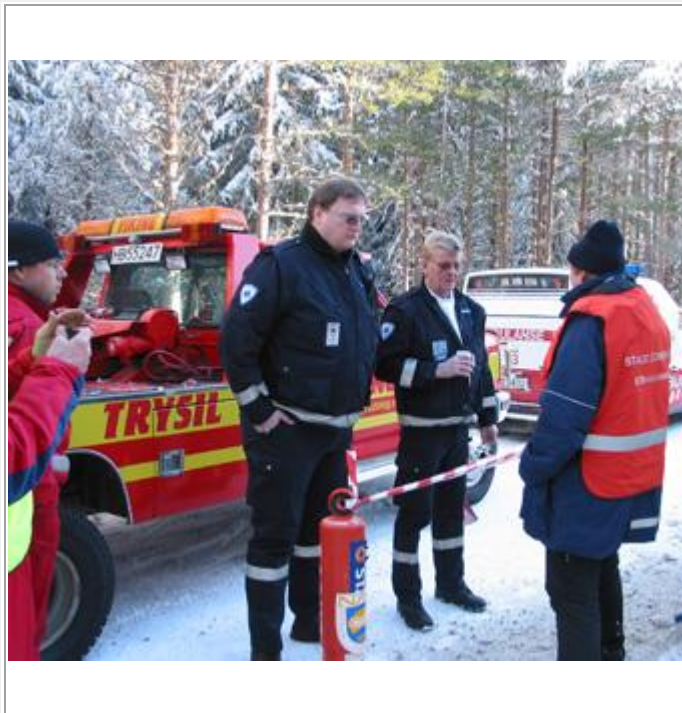
Viking er også på plass de nærmer seg 0 bil.