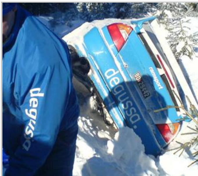
Fram med skuffa, Rune Dalsjø parkerte på 1 ern.