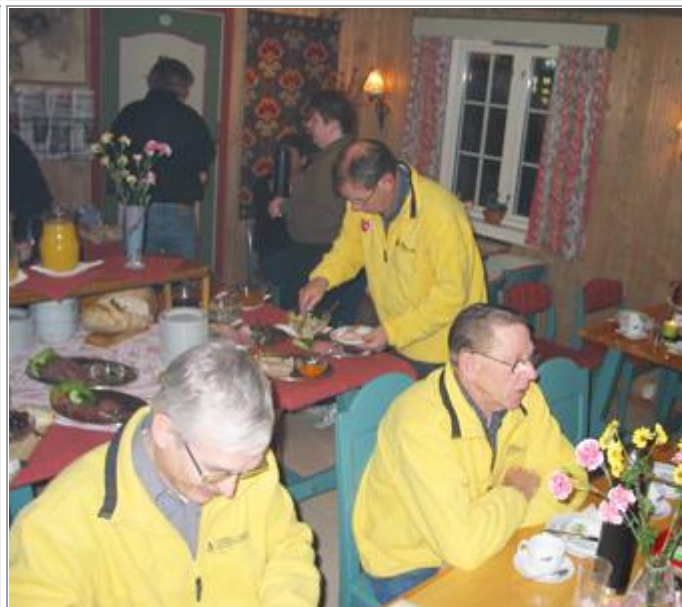
Nattmat min tid.