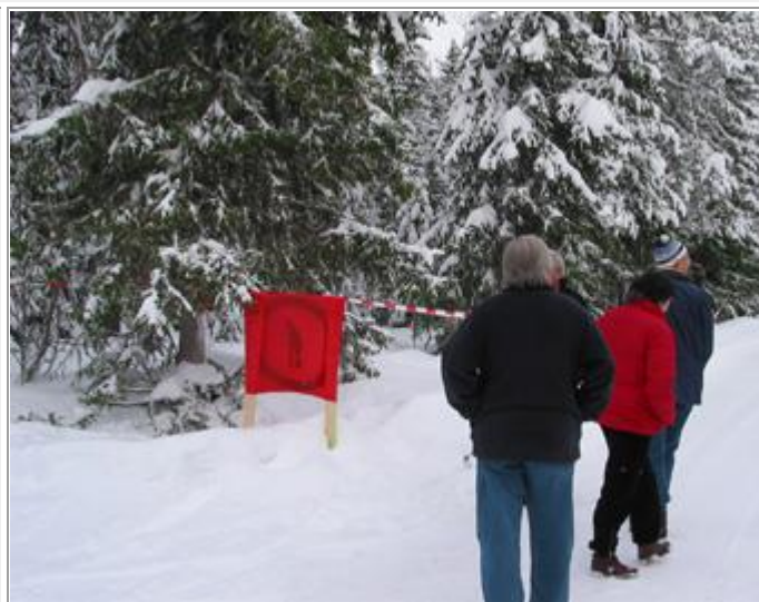
Willum var usikker på om det var plass til starteren, her må det skuffes hvis ikke freseren kommer til i morgen.