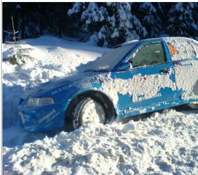
Men jernet var like helt.