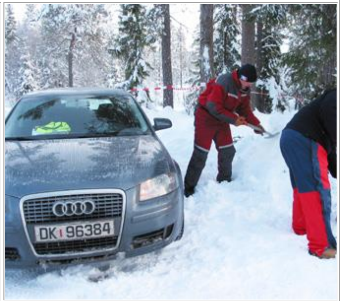
Måking må til for å få plass til starterbilen.