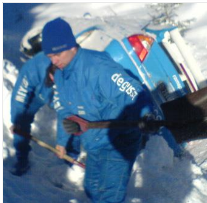
Det måtte bare skuffes litt.