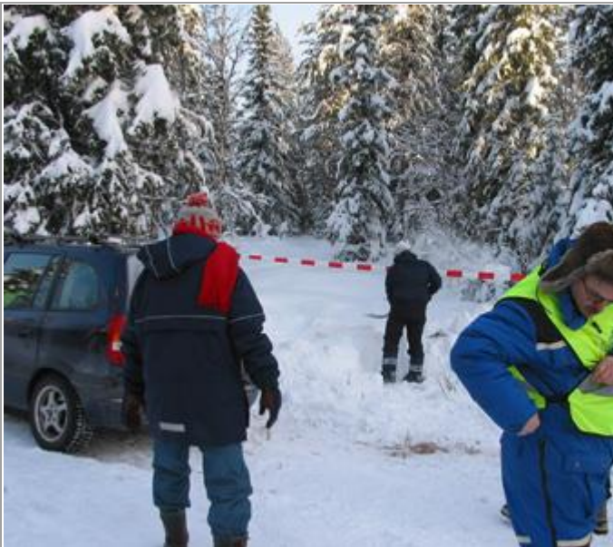
Hvor er hempa Paul?