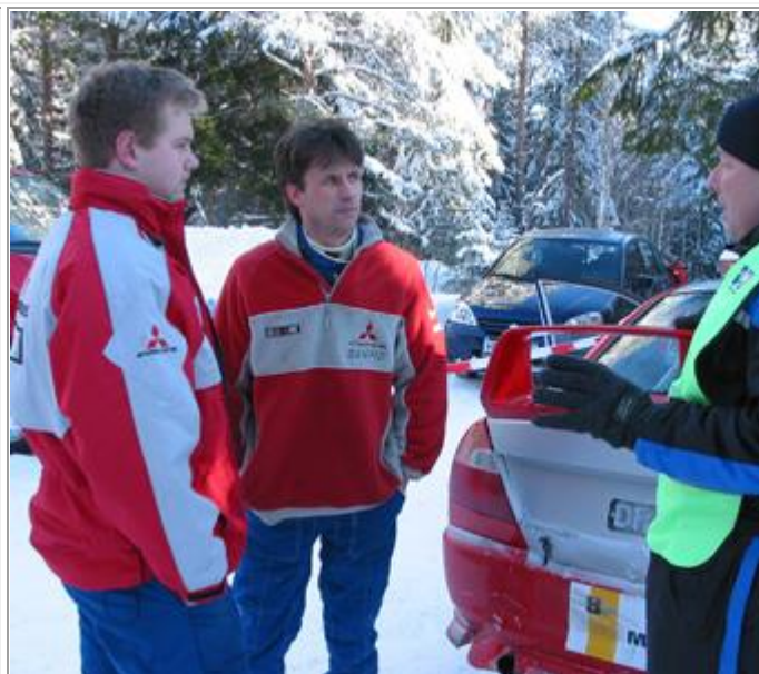
Bruno foredrar om reglementet tenker jeg, gutta måtte bryte.