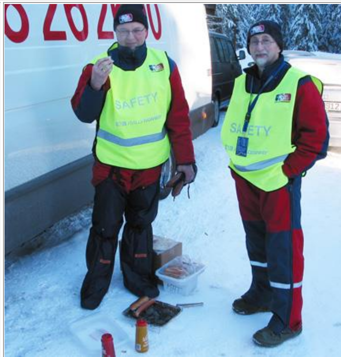
Foring hadde vi tid til mellom 1 og 3 ern.