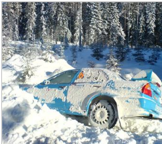
Vi var der for å permittere vakter når 3 ern var fedig.