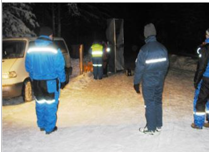
Klokken kom og vi tar fatt på monteringen, 0245, ca tid.