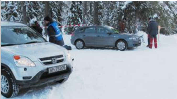
Opprigging start ss12