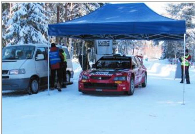
Carlson kom som nestemann.