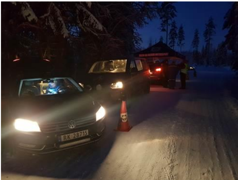
TK start gjør seg klar for løp i -22.